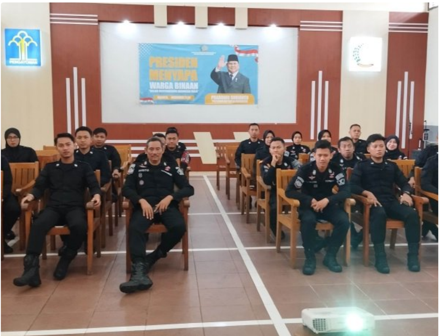
Rutan Blora Ikuti Sosialisasi Pedoman Uji Kompetensi Jabatan Fungsional Pembina Keamanan dan Pengaman Masyarakat

Blora - Rumah Tahanan Negara (Rutan) Kelas IIB Blora turut berpartisipasi