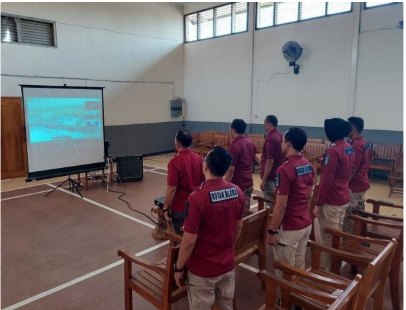
Rutan Blora Ikuti Webinar Series 5 Bersama BPSDM Hukum dan HAM

Blora – Rumah Tahanan Negara (Rutan) Kelas IIB Blora Kantor Wilayah Kementerian Hukum dan Hak Asasi Manusia (Kemenkumham) Jawa Tengah mengikuti Webinar Series 5 bertema “Powerful Coaching, Mentoring, dan Counseling untuk Perubahan Organisasi dan Pengembangan Kompetensi ASN.”